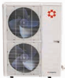
Наружный блок KSUT140-176HFAN3